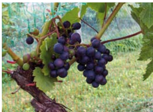
Sorten Rondo mognar i september.

Idag omfattar odlingen ca 160 vinrankor och till våren kommer det att planteras lika många till. Plantorna är av sorten Rondo , som är anpassad till nordiska förhållanden. Rondo har kraftig växt och stora blåa druvor i täta klasar. Skalet på druvorna är något segt, så sorten rekommenderas inte som bordsfrukt utan till saft eller vin. Sorten ger skörd i slutet av september.